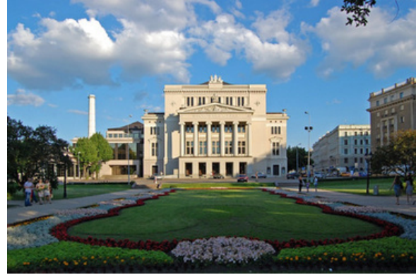
Jāzeps Vītols Latvian National Opera Academy of Music

Se hicieron nuevos monumentos, y algunos de ellos, como el Monumento a la Libertad (terminado en 1935) y el Cementerio de los Hermanos (homenajeado en 1936), han llegado a representar a Letonia en su conjunto. La plaza Doma adquirió su forma actual en la década de 1930, con su estructura clave: el Palacio de Justicia (actual sede del Gabinete de Ministros y del Tribunal Supremo). Ese mismo año se diseñaron otros locales como el Almacén Económico del Ejército (actual "Galerija Centrs") y el Mercado Central de Riga, el mayor mercado y bazar de Europa.