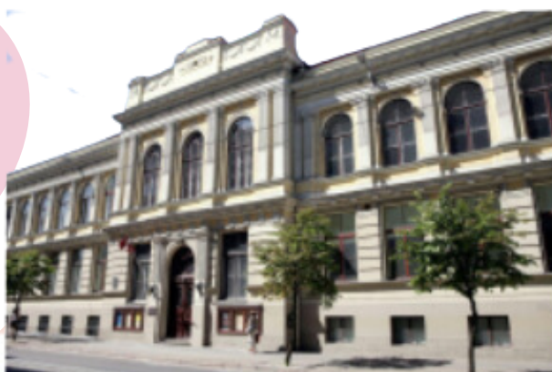
Jāzeps Vītols Latvian Academy of Music

Riga è stata scelta come capitale della Lettonia al momento della formazione della Repubblica di Lettonia. Gli edifici della città riflettono i primi anni di indipendenza del paese, nonché la storia degli anni '20 e della fine degli anni '30. I nomi delle strade a Riga iniziarono a essere rinominati in lettone già nel 1918, ma nel 1936 numerose piazze e 336 strade furono ribattezzate. L'Università della Lettonia, l'Accademia lettone delle arti e altre organizzazioni educative e culturali hanno iniziato il loro lavoro. In quegli anni, ci sono state molte star e talenti del palcoscenico tra i diplomati del Conservatorio di Stato lettone, oggi Jāzeps Vītols Latvian Academy of Music - che hanno attivato la vita musicale anche in altre città lettoni, fondando scuole di musica e conservatori popolari. L'Opera Nazionale, chiamata anche Casa Bianca di Riga, ha svolto un ruolo centrale nella vita musicale di Riga negli anni 1920-1940. Il numero di nuove produzioni al National Theatre ha raggiunto le 27 produzioni a stagione, presentando in anteprima una nuova uscita ogni due settimane.