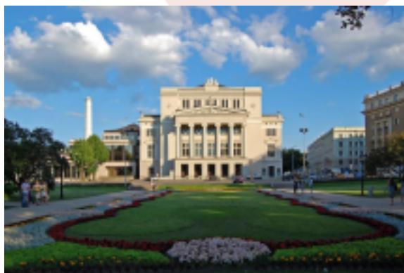
Jāzeps Vītols Latvian Music Academy National Opera

Tika veidoti jauni pieminekļi, un daži no tiem, piemēram, Brīvības piemineklis (pabeigts 1935. gadā) un Brāļu kapi (godināti 1936. gadā), ir kļuvuši par visas Latvijas reprezentāciju. Doma laukums savu pašreizējo veidolu ieguva 20. gadsimta 30. gados, un tā galvenā būve bija Tiesu pils (tagad Ministru kabineta un Augstākās tiesas mītne). Tajā pašā gadā tika projektēti arī citi veikali, piemēram, Armijas ekonomiskais veikals (tagad "Galerija Centrs") un Rīgas Centrāltirgus - lielākais tirgus un bazārs Eiropā.